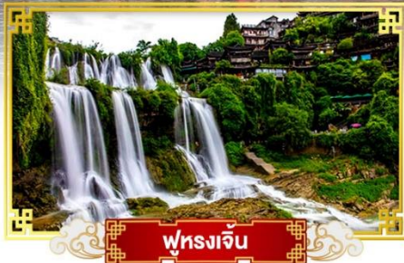
ฟุ่หลงเจิ้น