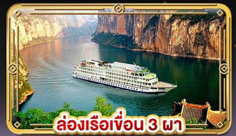
ล่องเรือเขื่อน 3 ภา