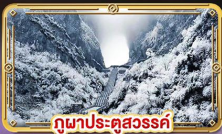
ภูผาประตูลสวรรค์