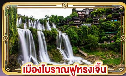
เมืองโบราณฟุหลงเจิ้น