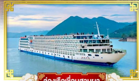
ล่องเรือเขื่อนสามผา